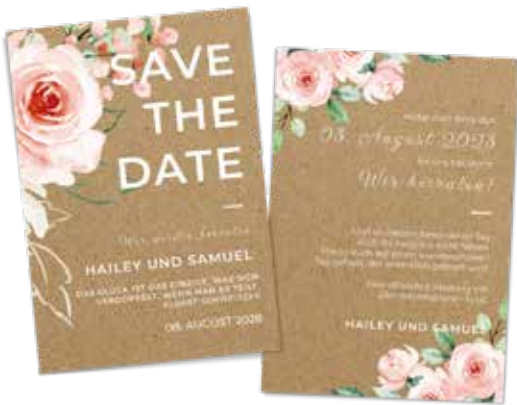
Save the Date Karte

Tipp: Immer Produkte der gleichen Serie auswählen, um einen einheitlichen Look auf Ihrer Hochzeit zu bekommen!